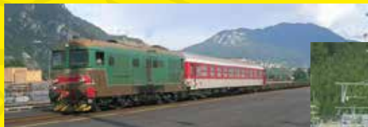
presso Trento-Roncafort