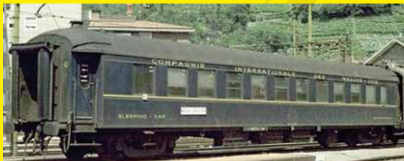
diretto 9498/9499 Roma-Tiburtina - Bolzano/Bozen a Bolzano 13/08/1982

Carrozza letti FS Ub ex CIWL 3879 Ansaldo, livrea CIWL senza logo CIWL, carrelli PPS, sofficietti Bourellet. (61 83 71-41 636-2).